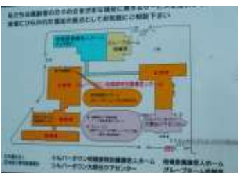
大野中地域包括支援センターはシルバータウン大野台ケアセンター内