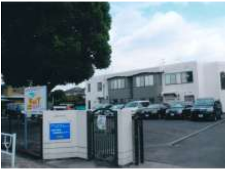
シルバータウン大野台ケアセンター 地域包括支援センターの正門

成年後見制度の普及活動と手続き等のお手伝いや、悪質な訪問販売などの対処や解約などのお手伝いも受け