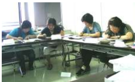
点字一覧表を見ながら点字を打っている 真剣な様子

字コースを選んでいただいていたので有難うございますと感謝の言葉がありました。 ① 視覚障がい者によりよい情報を提供ね。 ② 一日三十分でもパソコンと練習ね。 この二点が、これから点訳をはじめるのに大切な心構えのようです。